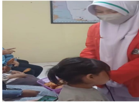
Gambar 3. Pembagian hasil inovasi MP-ASI sempol ayam sayur