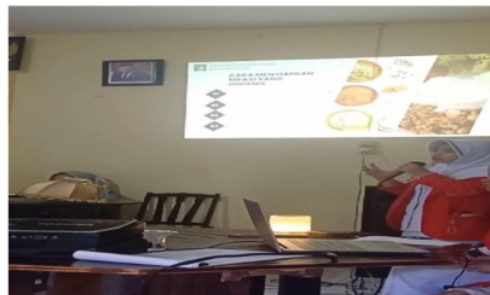
Gambar 2. Presntasi materi penyuluhan stunting dan pemutaran video demonstrasi pembuatan inovasi MP-ASI semplo ayam sayur.