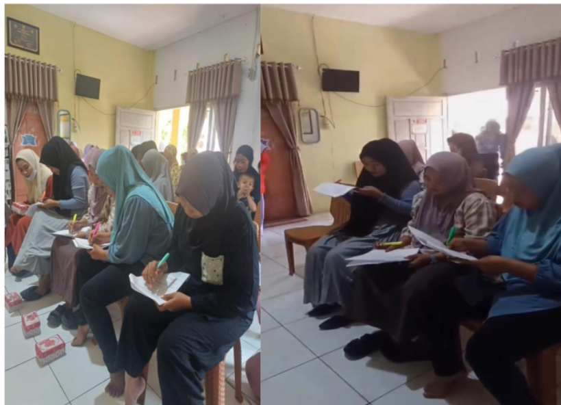
Gambar 3. Pengisian soal pretest dan posttest