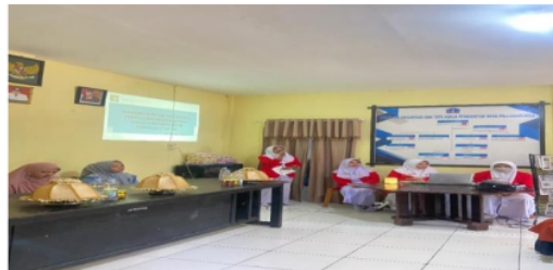
Gambar 1. Pembukaan kegiatan pengabdian

Kegiatan Pengabdian Masyarakat ini sudah di lakukan sesuai tahap yang di rencanakan. Kegiatan ini di lakukan bersama responden yakni WUS (Wanita Usia Subur), tim Dosen dan Mahasiswa. Pada Gambar di bawah ini adalah jalan nya kegiatan yang dilakukan pada saat.