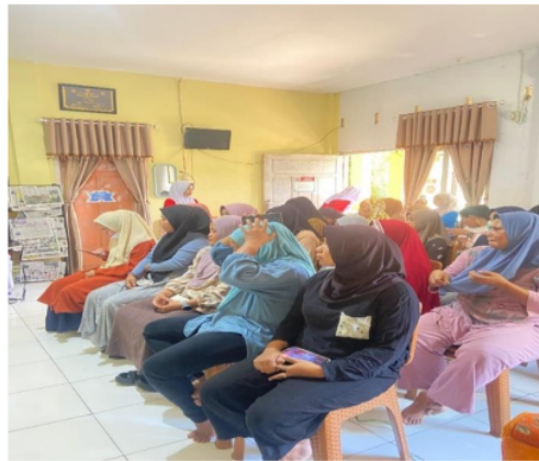
Gambar 4. Sasaran penyuluhan