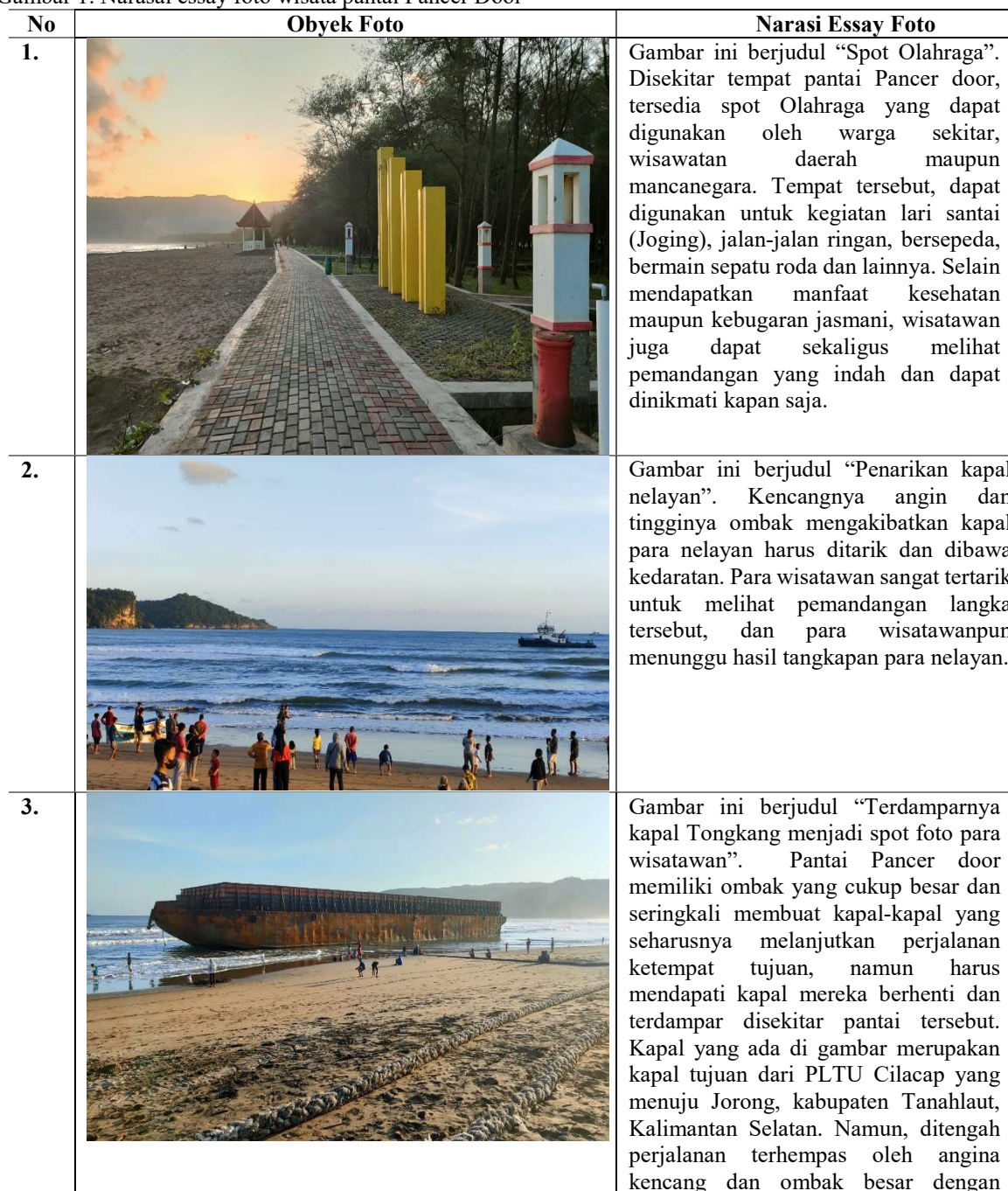
Gambar 1. Narasai essay foto wisata pantai Pancer Door

Obyek wisata dapat dimanfaatkan untuk pelajar melakukan pembelajaran di ruang terbuka. Seperti halnya para nelayan yang sedang mencari ikan, peserta didik bisa langsung melihat bagaimana para nelayan menangkap ikan, dan jenis biota laut apa saja yang ditangkap. Kemudian untuk penanaman tumbuhan mangrove yang ada di sekitar pesisir pantai, guru dapat mengajak peserta didik untuk ikut membantu dalam penanamannya. Adapun juga kawasan pantai yang menyediakan tempat untuk berkemah. Sehingga kesimpulan dari studi pustaka, kawasan wisata pantai Pancer Door terdiri dari tiga fungsi diantaranya fungsi akomodasi, rekreasi, dan olahraga. Menurut peraturan lahan pada RTBL, ketiga fungsi tersebut dipilih.