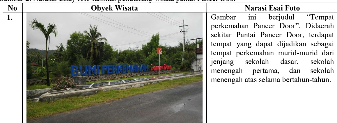
Gambar 2. Narasai essay foto fasilitas pendukung wisata pantai Pancer Door

Keberadaan obyek wisata pantai Pancer Door memiliki sarana dan prasarana yang sangat mendukung. Seperti halnya tersedia tempat perkemahan, wisata kuliner, area parkir, toilet, dan tempat ibadah. Wisatawan bisa menikmati keindahan pantai dengan sarana dan prasarana yang lengkap. Untuk gambar yang ke 2 memperlihatkan beberapa fasilitas pendukung pantai Pancer Door dengan narasi essay.