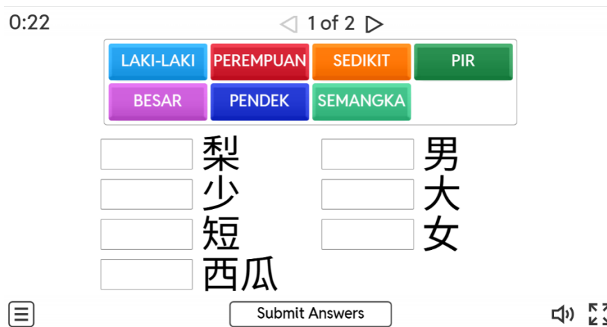
Gambar 3. Hasil implementasi Wordwall.

Penggunaan Wordwall tidak hanya mampu menciptakan suasana kelas yang lebih interaktif dan menyenangkan, tetapi juga meningkatkan minat belajar siswa. Media ini turut membantu siswa dalam melakukan review materi secara mandiri maupun bersama pengajar dengan format yang lebih menarik dan mudah dipahami. Selain itu, Wordwall memudahkan pengajar untuk melakukan evaluasi pembelajaran secara cepat melalui fitur laporan hasil pengerjaan siswa. Dengan penerapan Wordwall sebagai bagian dari strategi pembelajaran digital, diharapkan dapat meningkatkan efektivitas pembelajaran, memperkuat pemahaman materi, dan mendorong partisipasi siswa secara lebih aktif.