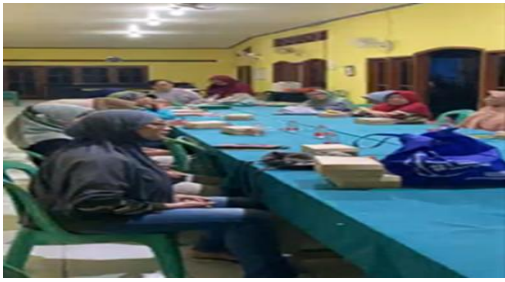
Gambar 1. Dokumentasi.