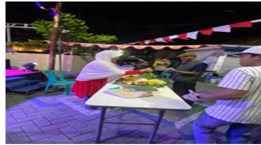
Gambar 2. Dokumentasi.

Gambar 1. Proses suasana dialog antara tim perguruan tinggi dan masyarakat Desa Ngingas di balai desa. Warga, tokoh masyarakat, dan mahasiswa duduk melingkar berdiskusi tentang makna tirakatan sebagai sarana menanamkan nilai persatuan dan gotong royong. Dosen memandu sesi refleksi, sementara peserta aktif berbagi pandangan.