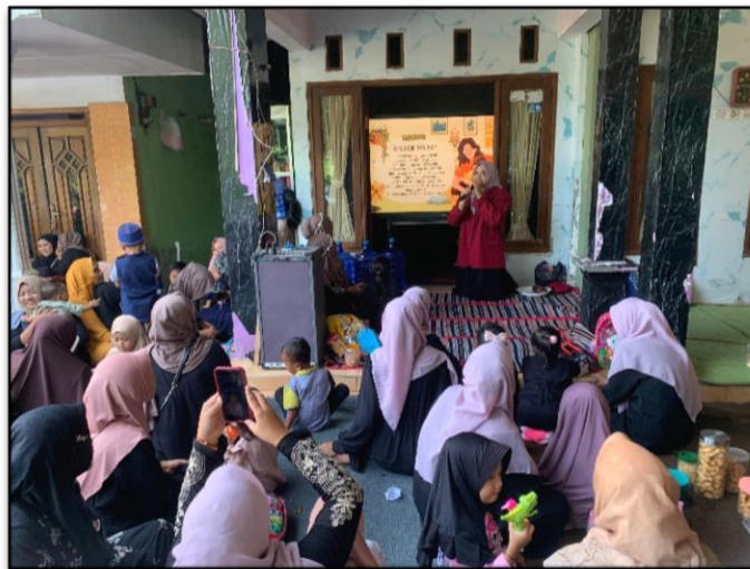
Gambar 2. Edukasi Speech Delay Bersama Ibu Wali Murid PAUD

Dengan demikian, kegiatan ini tidak hanya meningkatkan kapasitas individu, tetapi juga mulai mendorong perubahan sosial dalam komunitas, seperti meningkatnya kesadaran bersama dan munculnya peran aktif beberapa peserta sebagai penggerak. Namun, agar dampaknya lebih berkelanjutan, diperlukan tindak lanjut berupa pendampingan atau program lanjutan. Pelaksanaan kegiatan pengabdian kepada masyarakat ini telah diselesaikan sesuai dengan tahapan yang telah ditetapkan sebelumnya, dengan melibatkan sinergi antara dosen, mahasiswa, pihak sekolah, serta para peserta yang berpartisipasi aktif dalam setiap rangkaian kegiatan sebagai upaya bersama dalam mendukung perkembangan bahasa anak usia dini secara optimal. Program edukasi yang dilakukan secara berkelanjutan cenderung memberikan dampak yang lebih stabil terhadap perubahan perilaku masyarakat dibandingkan program yang hanya dilakukan satu kali kegiatan (Green & Kreuter, 2005).