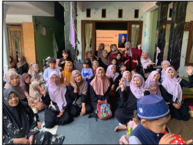
Gambar 3. Foto bersama peserta yang mengikuti Kegiatan Edukasi Speech Delay