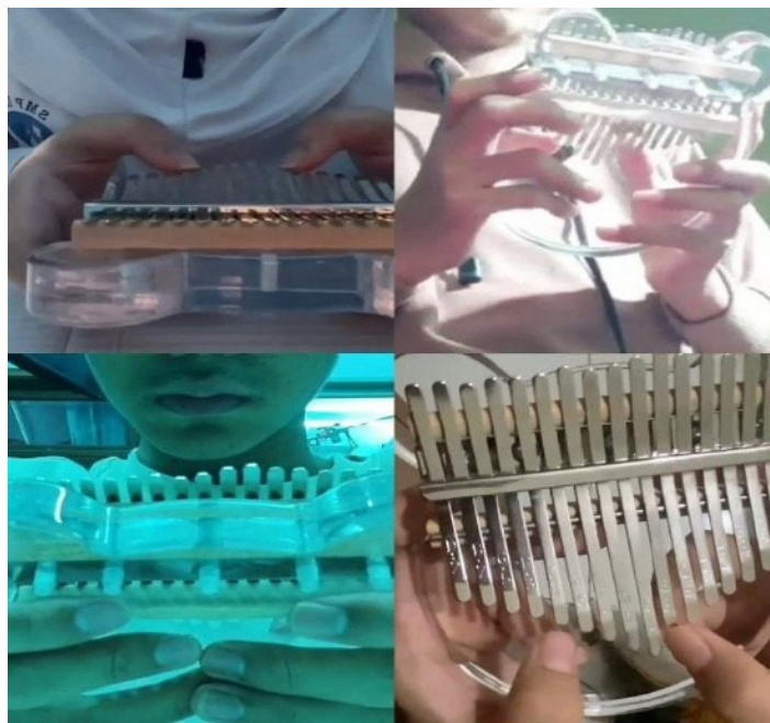
Gambar.1 Praktik memainkan instrumen kalimba Siswa

bentuk penilaian yang tetap memberi ruang kepada siswa untuk menampilkan hasil latihan mereka secara individual melalui media digital. Dalam proses perekaman video, siswa terlihat lebih memperhatikan kesiapan permainan, hasil penampilan, dan proses penyajian sebelum video dipublikasikan. Beberapa siswa melakukan perekaman ulang beberapa kali untuk memperoleh hasil permainan yang lebih baik sebelum video diunggah. Situasi tersebut menunjukkan bahwa siswa tidak hanya mempersiapkan permainan musik, tetapi juga membangun kesiapan emosional sebelum menampilkan hasil praktik mereka kepada orang lain.